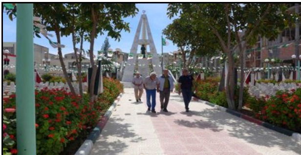
Cimetière mémorial d'Ighzer Amokrane, en Kabylie

La Guerre d'Algérie – dont ils n'ont pu parler - a dévasté leurs jeunesse. Aujourd'hui, au moment de toucher leurs « retraites du combattant », ils disent : « Cet argent, nous ne pouvons pas le garder, pour nous-mêmes. » Alors, ils le collectent et le redistribuent à des associations, en Algérie. Avec ces projets solidaires, leurs cœurs ont rajeuni. Eux, qui s'étaient tus si longtemps, parlent enfin, rencontrent des jeunes... Et retournent en Algérie.